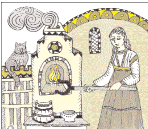
Рисунок Кристины Звезжинской

Далее учитель показывает детям предметы быта (или их изображения), без которых хозяйка у печи не могла обходиться; предлагает записать их названия, с объяснением назначения, в тетрадь: дрова – ими топили печь; топор – им рубили дрова; помело – им выметали золу из внутренности печи ( печного пода ) перед тем, как посадить туда хлеб; глиняный горшок – для хранения продуктов и варки пищи; ухват – им доставали горшки из печи; кочерга – клюка, которой перемешивали в печи прогоревшие дрова; бочка – в ней хранили воду; деревянное ведро – в нем приносили воду из колодца; коромысло – деревянная дуга, на концах которой женщины на плечах переносили ведро с водой; ковш – им черпали жидкость, сыпучие вещества.