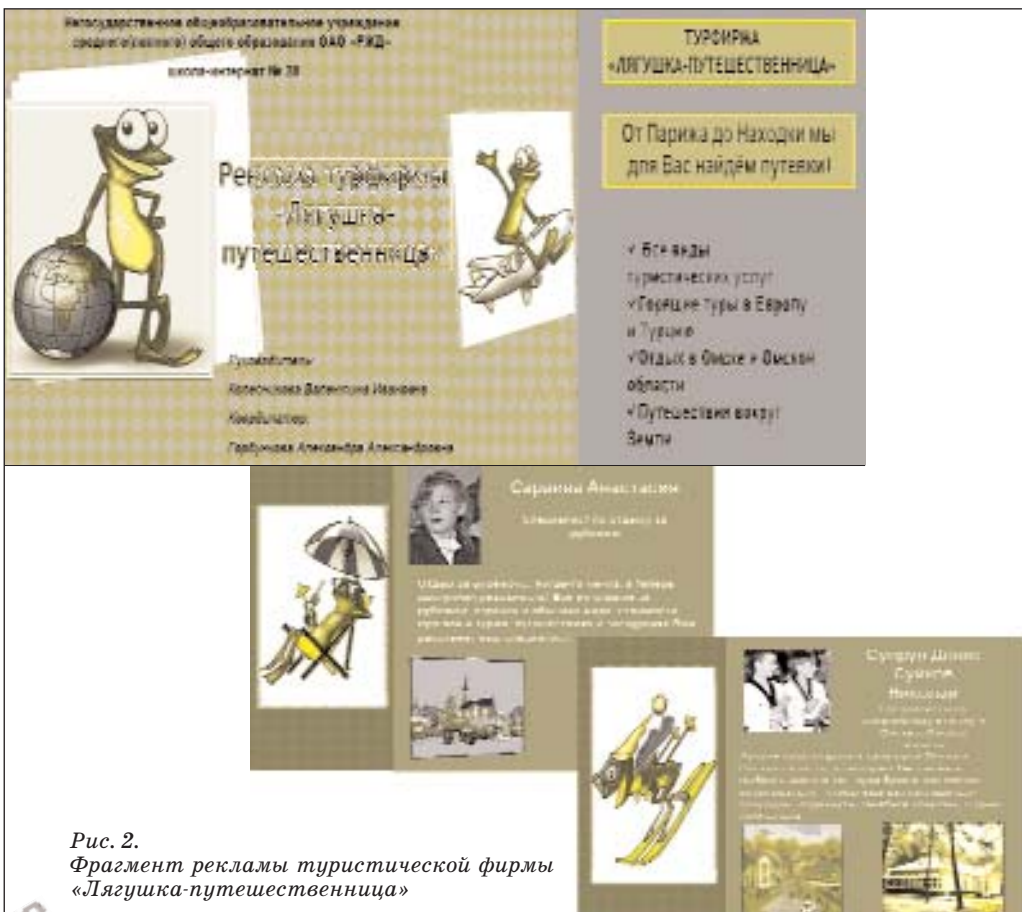
Рис. 2. Фрагмент рекламы туристической фирмы «Дягушка-путешественница»

Сетевой интеллектуально-творческий проект «Музей – это "Эврика!"» проводился в шесть этапов. На каждом из них участникам предстояло заполнить страницу справочника юного экскурсовода «Наши Омские