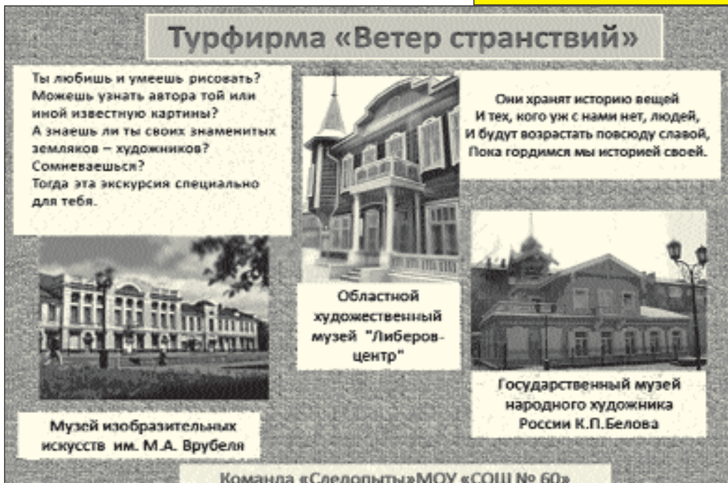
Рис. 4. Эскиз листовки-приглашения туристической фирмы «Ветер странствий»