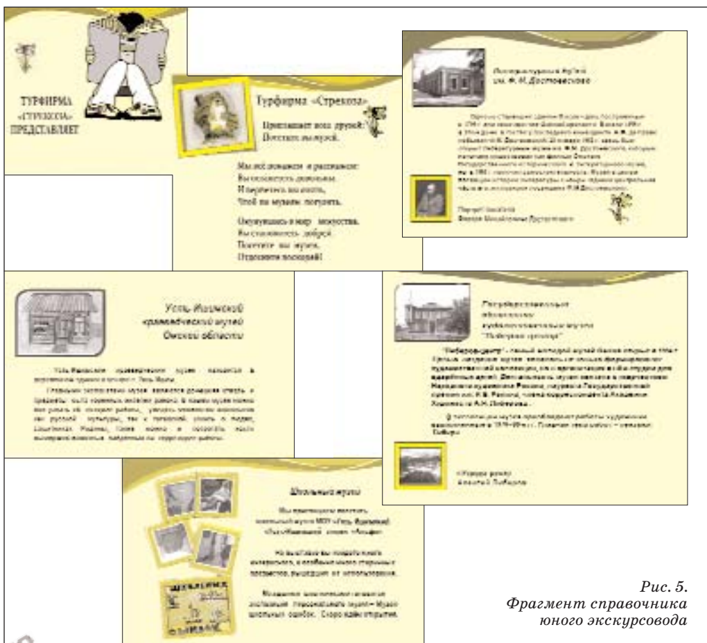
Рис. 5. Фрагмент справочника юного экскурсовода