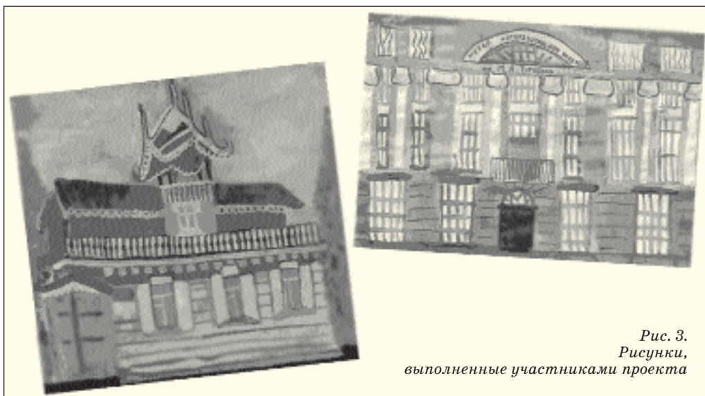
Рис. 3. Рисунки, выполненные участниками проекта

музеи», разместив там необходимую информацию, указанную в соответствующем задании.