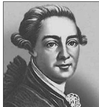
3 М.М. Херасков