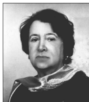
6 Н.И. Сац

Возглавлял единственный в мире Театр зверей.