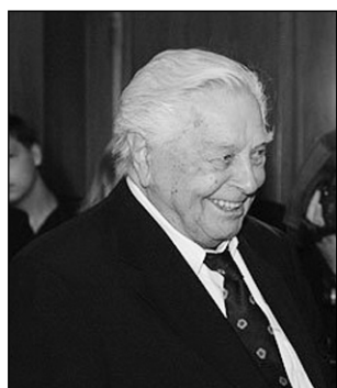
1 Ю.П. Любимов

Рассмотри портреты деятелей культуры. Рядом с каждым портретом стоит цифра. Поставь нужную цифру рядом с соответствующим предложением. При необходимости перечитай текст.